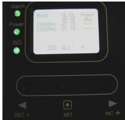
Рис.1 Дисплей и панель управления